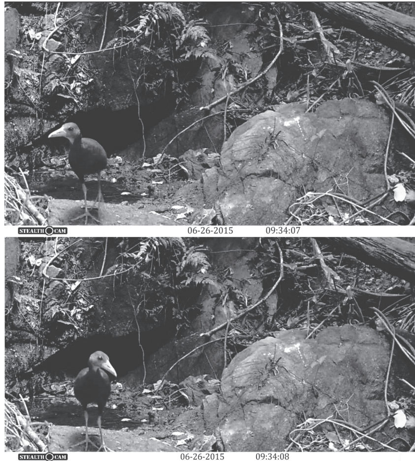
Figura 1. Fotocaptura de Aramides axillaris tomadas en el ADVC El Gavilán, Municipio de Santa María Tonameca, Oaxaca.

2002). La mayoría de las especies de este grupo presentan cuerpos angostos que les permiten moverse fácilmente entre la vegetación, sin ser vistos o escuchados (Taylor 1998, Bolaños & Alvarado 2012). Consideramos que el presente registro del rascón cuellirufó es notable por dos razones: la altitud y la vegetación. El ADVC El Gavilán es una ANP relativamente pequeña y hasta la fecha no se contaba con registro alguno sobre la presencia del rascón dentro de su polígono, e incluso las personas que integran el grupo comunitario de protección de esta ANP mencionan que no conocían a esta especie. El sitio del registro se ubica dentro del núcleo agrario de San Francisco Cozoaltepec, en el Municipio de Santa María Tonameca, justo en la región donde se considera inician las altas montañas de la Sierra Sur y que superan los 1000 m de altitud. En el estado de Oaxaca, el registro más cercano de esta especie se ubica a 51 km en línea recta en la Laguna de Manialtepec, Oaxaca (Fig. 2).