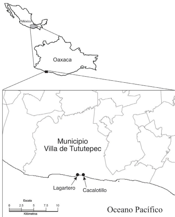
Figura 1. Ubicación del sistema lagunar Lagartero y Cacalotillo, Municipio de Villa de Tututepec de Melchor Ocampo, Oaxaca (Mapa: Jesús García Grajales).

no superiores a los 2 km de longitud, mientras que en el sistema Cacalotillo se estableció un solo transecto (ruta) de 0.606 km de longitud debido a su extensión. En cada sistema se realizaron recorridos nocturnos simultáneos de manera mensual durante la fase de luna nueva, de noviembre de 2013 a abril de 2014 sobre dos lanchas de fondo plano de 3.5 m de largo y propulsada con remos, con un esfuerzo de seis personas en total. Los recorridos se realizaron de manera sistemática entre las 22 y 01 h, con una repetición en la noche siguiente. Por cada recorrido se contabilizaron los cocodrilos para determinar la tasa de encuentro (ind./km lineal) a través del método descrito por Chabreck (1966), el cual consiste en el conteo visual nocturno, ubicando a los organismos por el destello de sus ojos a través del reflejo de un haz de luz. Asimismo, se estimó la separación de los ojos, así como la distancia de estos a la punta del hocico con la finalidad de determinar visualmente la longitud total (LT) de cada organismo (Messel et al. 1981, Thorbjarnarson 1989).