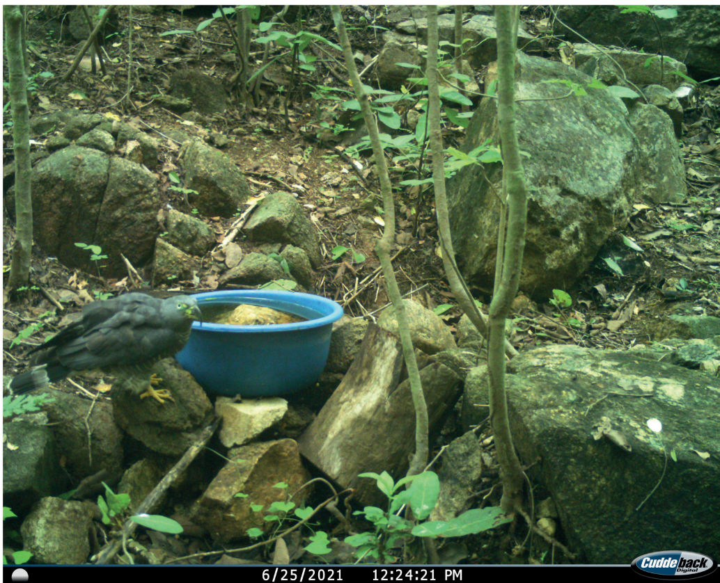
Figura 1. Secuencia de registro fotográfico de Chondrohierax uncinatus en cercanía al bebedero artificial instalado dentro del Jardín Botánico de la Universidad del Mar.